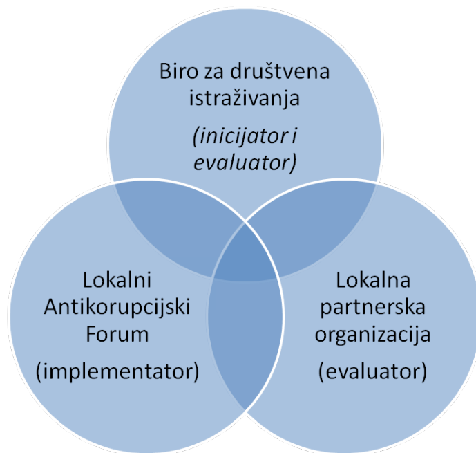
Shema 1. Akteri u procesu kreiranja, realizacije, monitoringa i evaluacije Lokalnog plana za borbu protiv korupcije